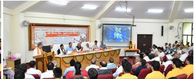
कृषि विश्वविद्यालय द्वारा दिनांक १८.०४.२०२६ को श्री दिव्य वेद, पुराण एवं गीता सनातन मूल्य संवर्धन पाठ्यक्रम कार्यक्रम का आयोजन।