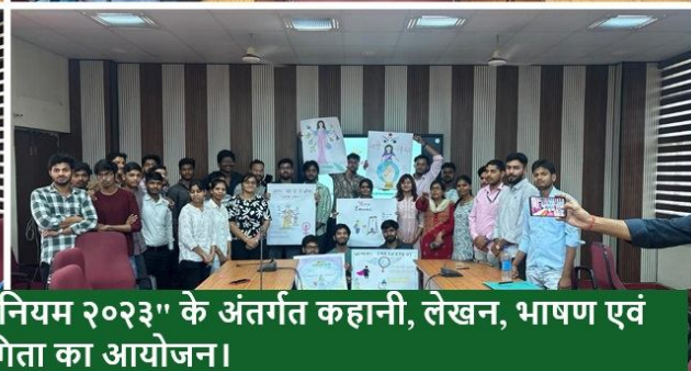
दिनांक १७.०४.२०२६ को "नारी शक्ति वंदन अधिनियम २०२३" के अंतर्गत कहानी, लेखन, भाषण एवं चित्रकला प्रतियोगिता का आयोजन।