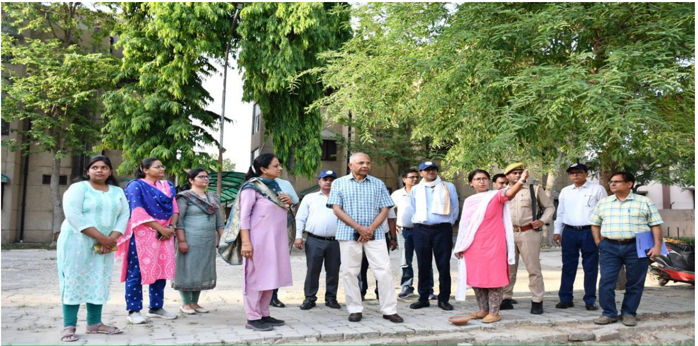
Visit of Hon'ble Vice Chancellor to observe the University Activities and Green Campus Status