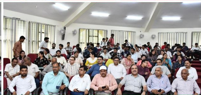
दिनांक १७.०४.२०२६ को "नारी शक्ति वंदन अधिनियम २०२३" के अंतर्गत लोकसभा की कार्यवाही का सजीव प्रसारण।