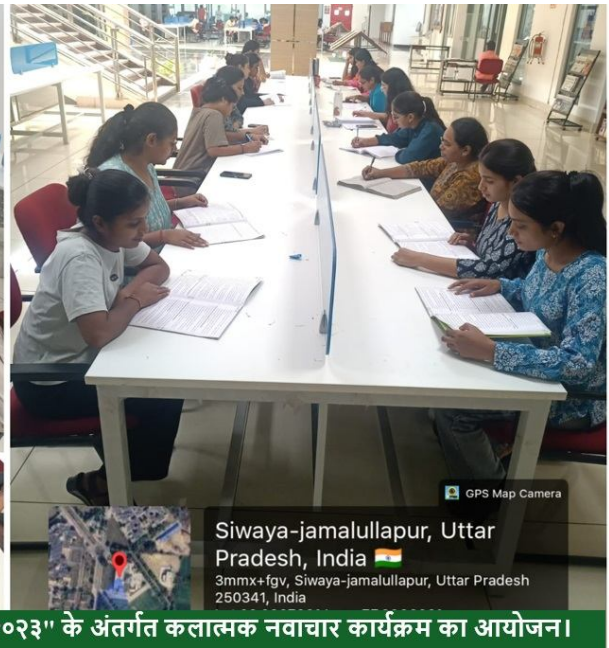
दिनांक १७.०४.२०२६ को "नारी शक्ति वंदन अधिनियम २०२३" के अंतर्गत कलात्मक नवाचार कार्यक्रम का आयोजन।