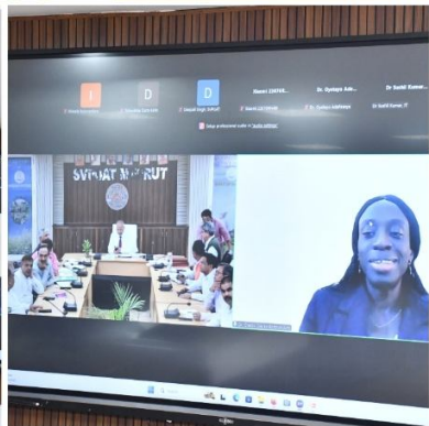
Glimpses of MoU Signing Ceremony between SVPUA&T., Meerut and the Floret Center, Nigeria