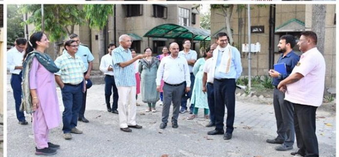
Visit of Hon'ble Vice Chancellor to observe the University Activities and Green Campus Status