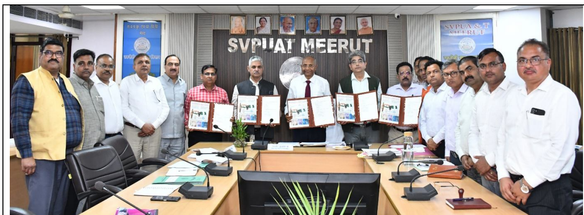
Glimpses of MoU Signing Ceremony between SVPUA&T., Meerut and the Floret Center, Nigeria

This collaboration marks another step forward in SVPUA&T's efforts to expand its global academic network and promote international research cooperation in emerging scientific fields.